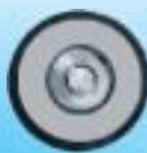
Special Collimator Lens